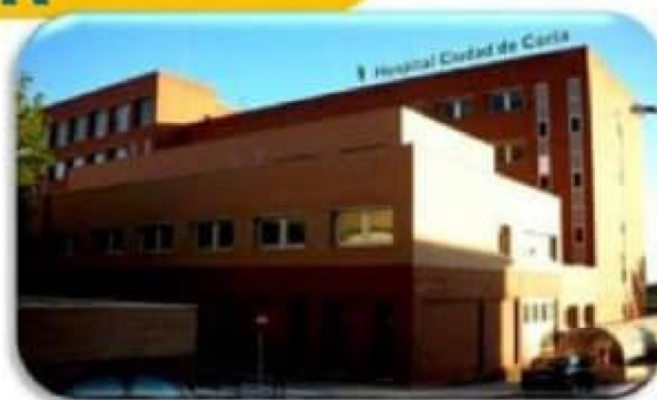
HOSPITAL CIUDAD DE CORIA