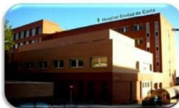
HOSPITAL CIUDAD DE CORIA