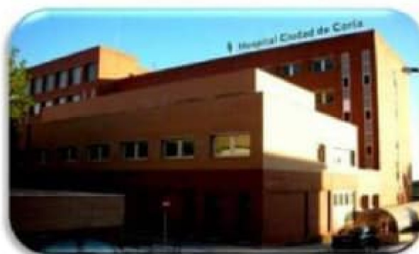
HOSPITAL CIUDAD DE CORIA